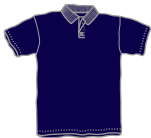
ドライタイプ ドライボタンダウンタイプ ポリエステル100%